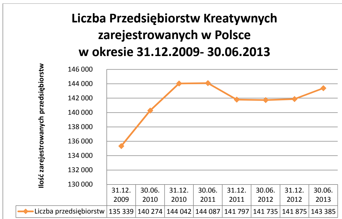
Rysunek 1. Liczba Przedsiębiorstw Kreatywnych zarejestrowanych w Polsce w okresie 1.07.2009- 30.06.2013