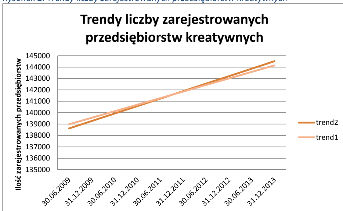
Rysunek 2. Trendy liczby zarejestrowanych przedsiębiorstw kreatywnych

Na rysunku 2 przedstawiono wykres trendu policzony dwiema metodami.